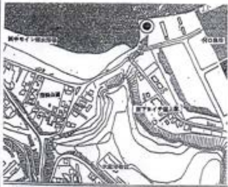
モイレミニ雪捨場(4t車以下)