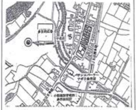
余市川雪捨場(国・道・町・一般者用)