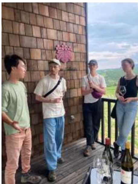
ワイナリーツアー通訳