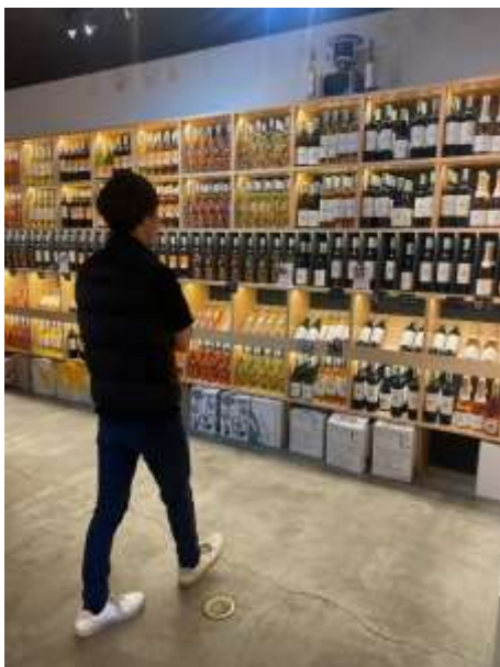
ワインショップ見学