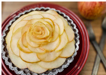
▲ リンゴカスターダルト