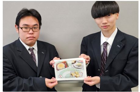
▲見るだけでも楽しいおしゃれなレシピ本です

レシピ本の配布は終了してしまいましたが、二次元コードで期間限定公開中です。ぜひ旬のフルーツを使って、余市町の特産品を味わってみてください！