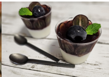
▲ ブドウの二層ゼリー