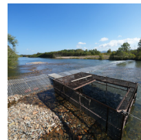
▲余市川の鮭の捕獲場

毎年9月になると余市川を遡上する鮭を捕まえ、ふ化させるために、川をふさいで鮭の捕獲場が設置されます。周囲には海から鮭を追ってきたのか、たくさんの鳥の姿が見られました。河川敷からでは迫力ある写真が撮れないと感じ、川の中へジャブジャブと。水面から出てきた鮭を狙う海鳥の撮影に成功しました。