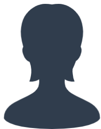
現役隊員の声その1

私たちが日常的にサポートしてくれる役場職員の皆さんは、こちらの問い合わせで分からない時があっても、すぐに調べて回答いただくので、 私たちが活動しやすいよう努力してくれている と感じます！