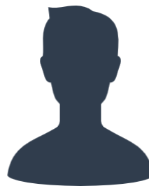
現役隊員の声その2

私たちが日常的にサポートしてくれる役場職員の皆さんは、こちらの問い合わせで分からない時があっても、すぐに調べて回答いただくので、 私たちが活動しやすいよう努力してくれている と感じます！