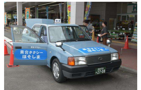
乗合タクシーほそしま (日向市)