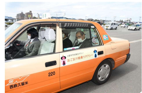
おごおり相乗りタクシー (久留米市)