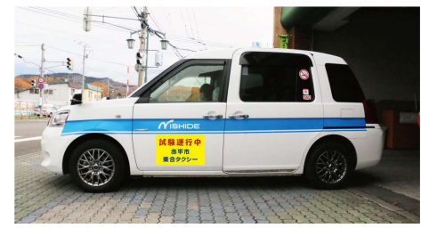
乗合タクシー実証運行 (赤平市)